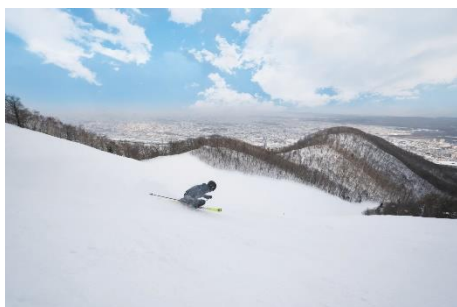
スキー/藻岩山 Skiing / Mt. Moiwa