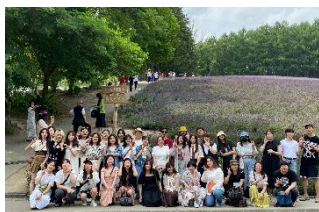
学外ツアー/Off Campus Bus Tour

Japanese Class, Japanese Cultural Event, Off Campus Bus Tour, etc.