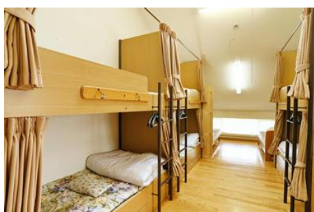
宿泊室 Guest Room