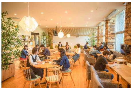
国際交流センター International Communication Center