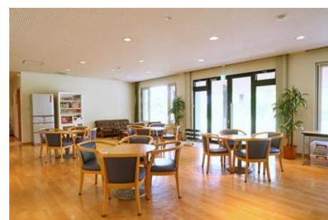
宿舎ロビー Dormitory Lobby