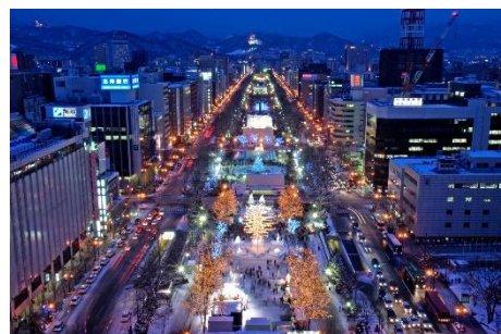
ホワイトイルミネーション White Illumination