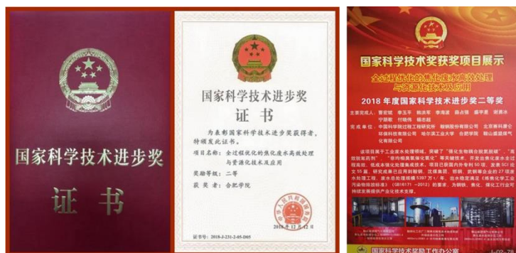
具有国际领先的产业化技术