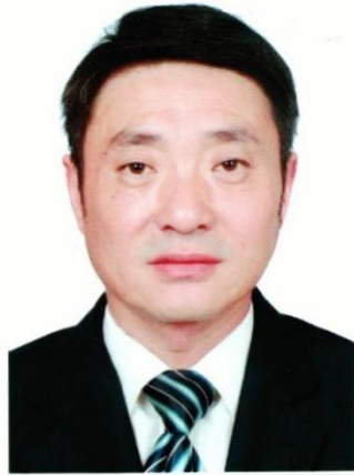
合肥学院能源材料与化工学院院长