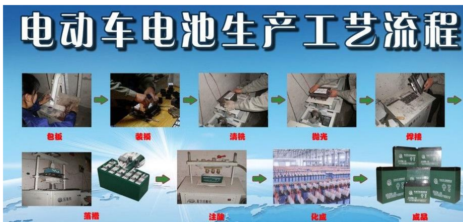
服务地方发展需求的产品