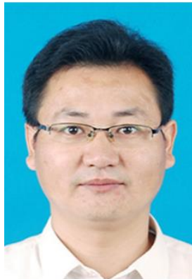
胡坤宏 教授（1975.11，博士、二级教授，安徽省教学名师、省创新人才、安徽省杰出青年基金获得者、安徽省十六届青年科技奖、合肥市专业技术拔尖人才）