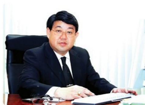
东亚大学校长--查瓦尼

泰国东亚大学是泰国著名的高等学校之一，东亚大学理事长为东南亚著名政治家、现任亚洲和平和解理事会主席、泰国前副总理、外交部长素拉格先生，东亚大学创办以来以高质量的教育和科研成果得到了教育界普遍赞誉。目前泰国东亚大学有泰国学生及外国留学生 4000 多名，其中包括 200 余名中国留学生。泰国东亚大学开设有学士、硕士研究生、博士研究生，共 35 个专业，涵盖文、理、商、医等学科。