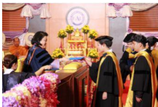
诗琳通公主为毕业学生授予学位

12. 学生待遇：学员可免费使用校园公共设施，包括图书馆、运动场所、校园医疗、无线网络。