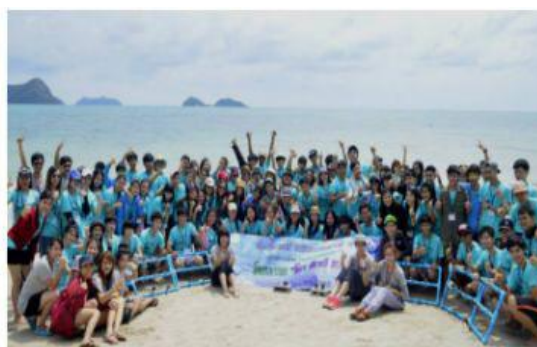
丰富多彩的校园活动