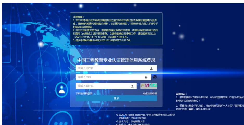
图 1 系统登录界面

请登录“工程教育专业认证管理信息系统” http://gcrz.ceeaa.org.cn/ （如图 1 所示）。